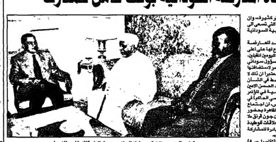
الرئيس المصري ويظهر السيد عثمان البشير في وقتها في القاهرة

الخرطوم اعلنت استيائها من استضافة القاهرة لاجتماعهم مبارك يطالب قادة المعارضة السودانية بوقف شامل للمعارك. الخرطوم اعلنت استيائها من استضافة القاهرة لاجتماعهم مبارك يطالب قادة المعارضة السودانية بوقف شامل للمعارك.